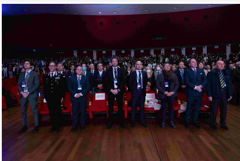
Il momento, emozionante, dell'inno nazionale