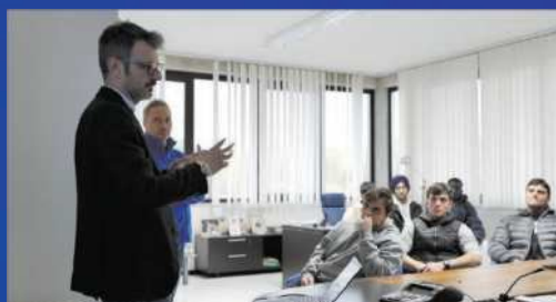
PMI day 2022 ragazzi in visita "FIMECO"