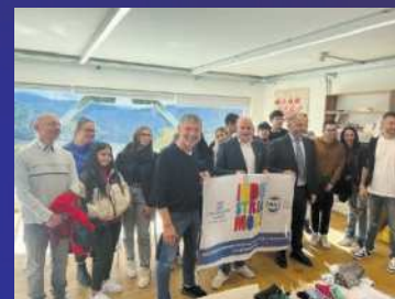
PMI day 2022 ragazzi in visita "GRAZIANO RICAMI"