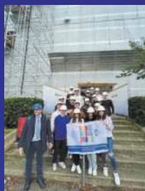
PMI day 2022 ragazzi in visita "PANICHI"