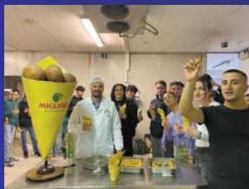
PMI day 2022 ragazzi in visita "MIGLIORI"