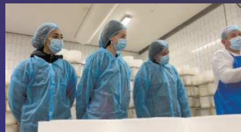
PMI day 2022 ragazzi in visita "SABELLI"