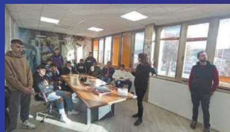
PMI day 2022 ragazzi in visita "MAFLOW"

Un particolare ringraziamento alle aziende e alle scuole che hanno aderito: Elantas Europe Srl, Enrico Paoletti e Figli Srl, Fainplast Srl, Fimeco Srl, G.E.M. Elettronica Srl, Inim Electronics Srl, Ip Telecom Srl, Linergy Srl, Maè Viaggi, Maflow Brs Srl, Migliori Olive Ascolane Srl, Neroni Group Srl, Nexans Italia Srl, Palazzo Dei Mercanti, Panichi Srl, Redorange Srl, Sabelli Spa, Smeraldo Suites e Spa, Straccia Packaging Srl, Webeing.Net, Ykk Mediterraneo Spa, e come ospite speciale sul tema della bellezza l'azienda Graziano Ricami Spa. Gli istituti scolastici partecipanti alla tredicesima edizione del PMI DAY con i vari plessi ed indirizzi sono stati l'IIS "Fermi Sacconi Ceci", l'IIS "A. Capriotti" e il Liceo Linguistico, l'IIS "Fazzini-Mercantini", l'IPSIA "A. Guastaferro", l'IIS "C. Ulpiani" (Alberghiero e Agrario), l'IIS "Mazzocchi - Umberto I", l'Istituto Alberghiero "F. Buscemi", il Liceo Scientifico "B. Rosetti"