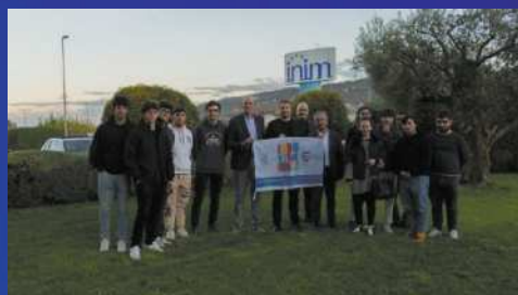
PMI day 2022 ragazzi in visita "INIM"