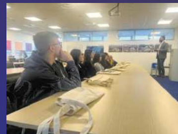
PMI day 2022 ragazzi in visita "ELANTAS"