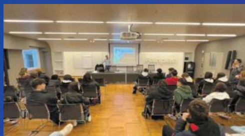
PMI day 2022 ragazzi in visita "FAINPLAST"