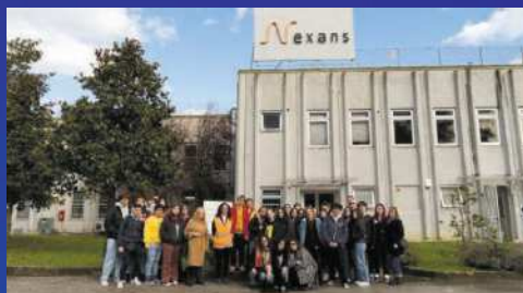
PMI day 2022 ragazzi in visita "NEXANS"