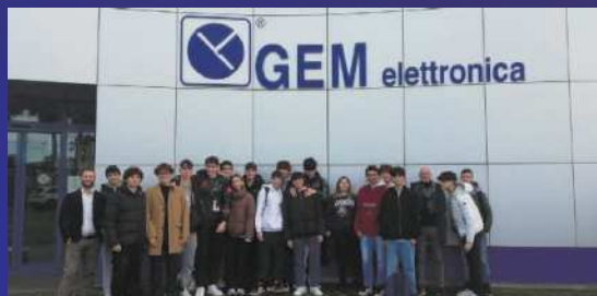
PMI day 2022 ragazzi in visita "GEM"